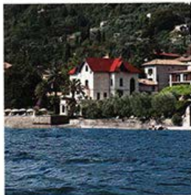
Villa Giulia in Gargnano am Gardasee: Verzauberte Landschaft und traumhafter Blick auf den See

Am Abend sitzt man bei Fackellicht direkt am Seeufer und genießt die hervorragende Küche des Hauses mit beispielsweise fangfrischem Fisch und den exzellenten Weinen der Region. Kein Wunder, dass dieser magische Ort im Sommer ein